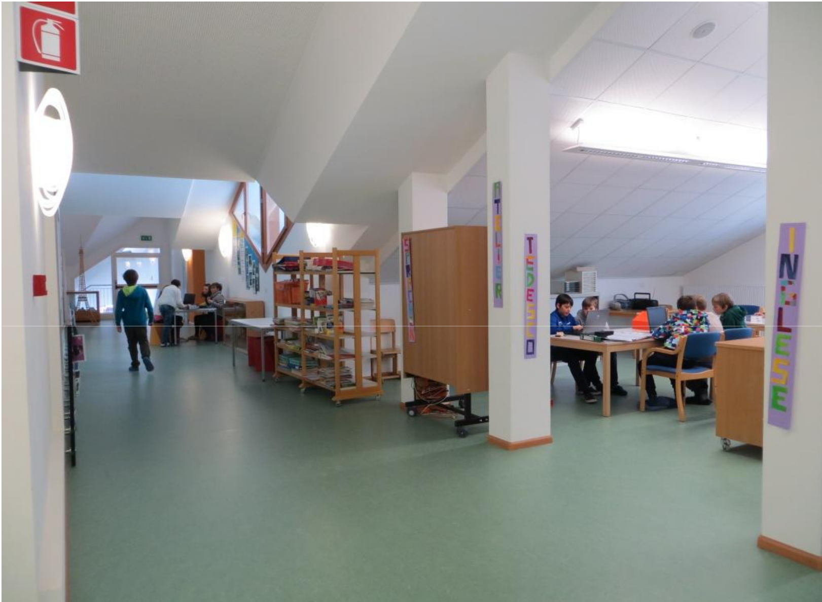
Der Atelierbereich auf der Südseite der Schule ist ein große offene Lernlandschaft.