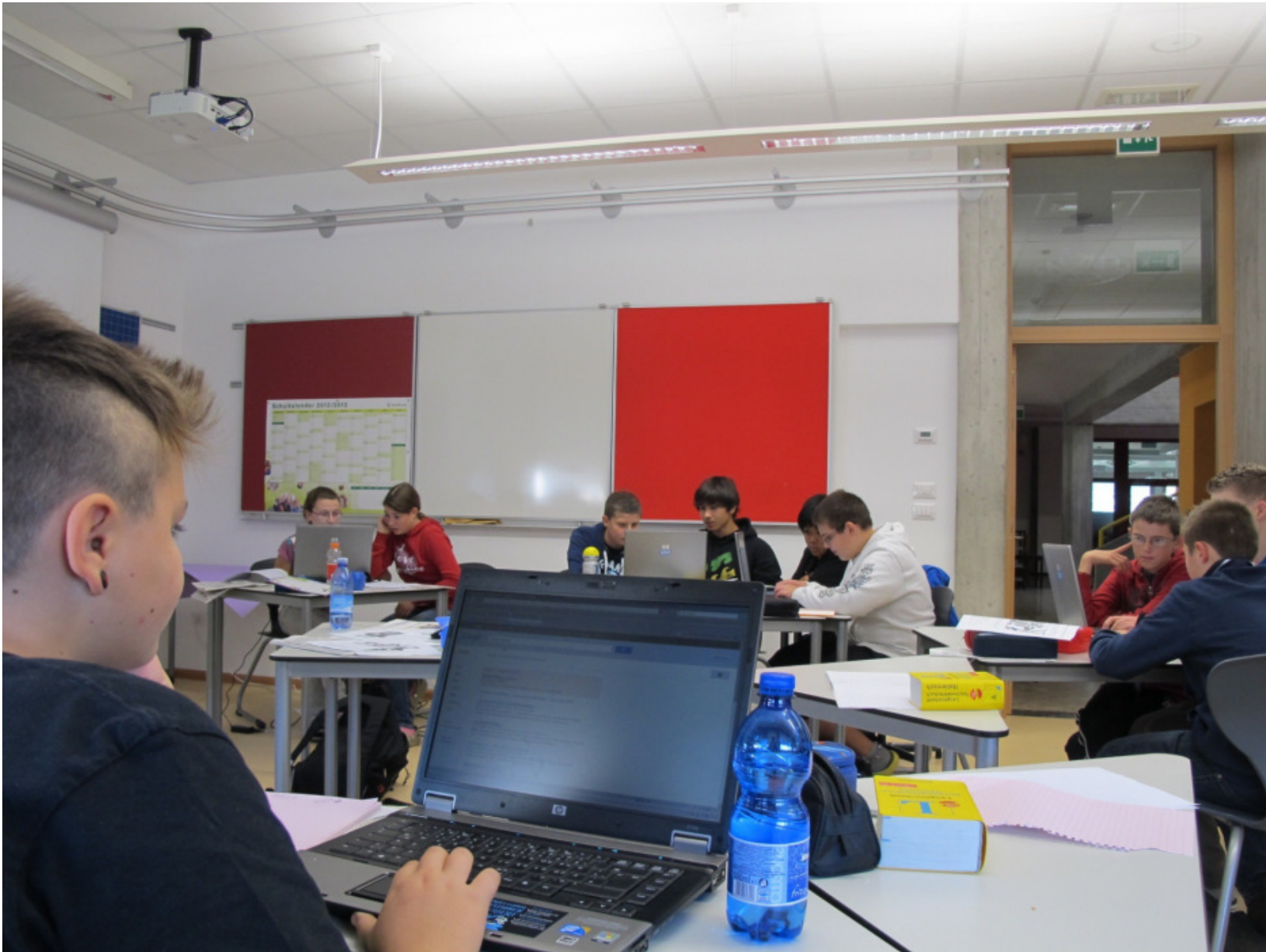
Mobile PCs stehen zur Verfügung.