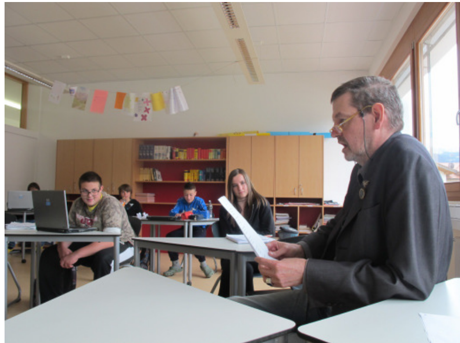
Werkstatt: Roman schreiben Arbeitsplatz ist überall!