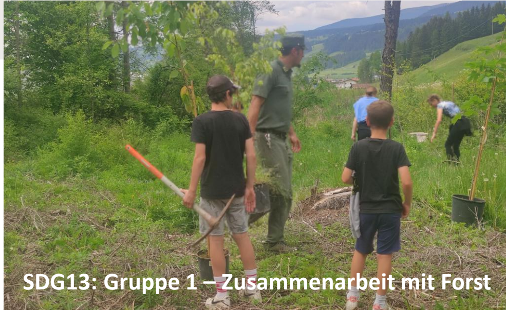
SDG13: Gruppe 1 – Zusammenarbeit mit Forst