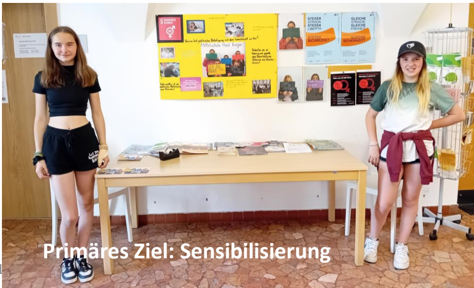
Primäres Ziel: Sensibilisierung