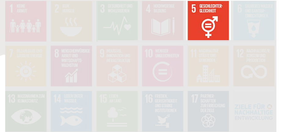
Nachhaltig: Zusammenarbeit mit Stakeholdern