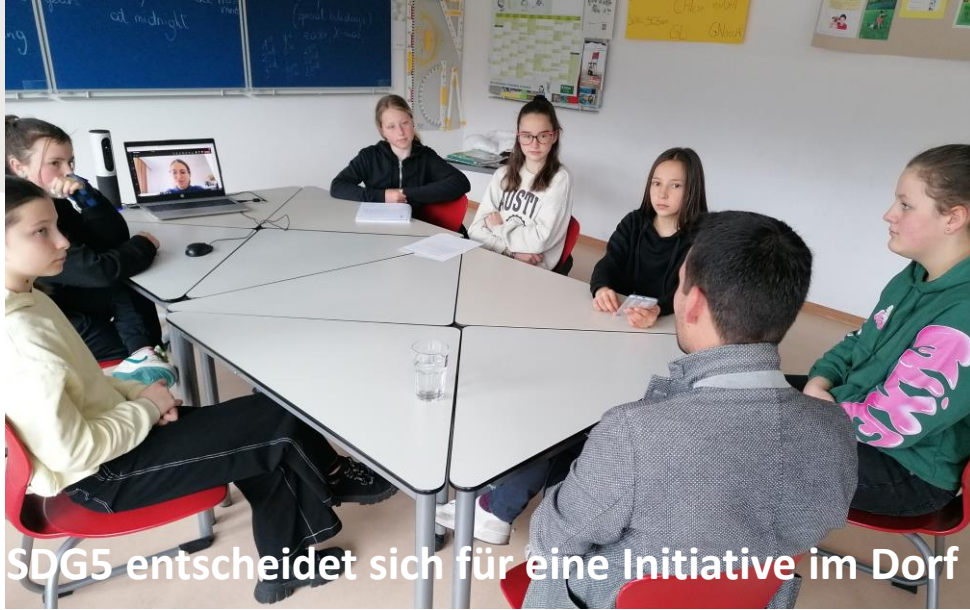
SDG5 entscheidet sich für eine Initiative im Dorf