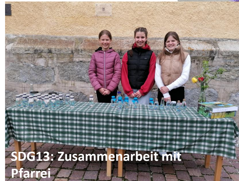
SDG13: Zusammenarbeit mit Pfarrei