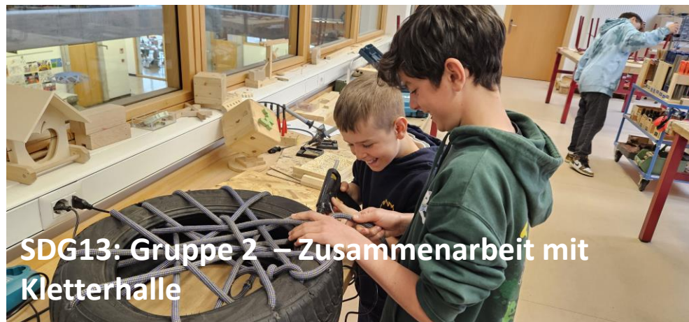
SDG13: Gruppe 2 – Zusammenarbeit mit Kletterhalle