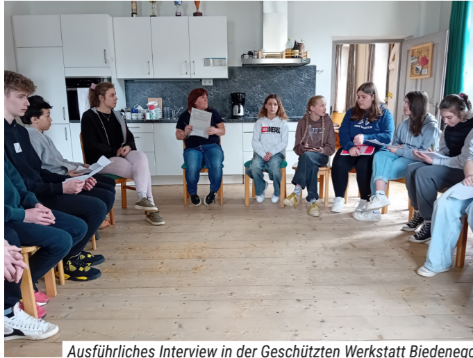
Ausführliches Interview in der Geschützten Werkstatt Biedenegg