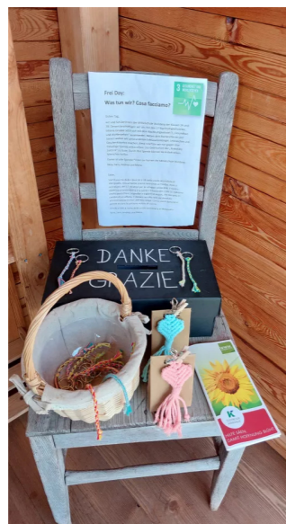
Aus Alt mach Neu ▶